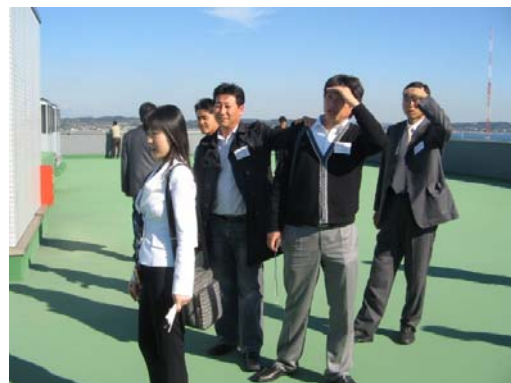
AFS 옥상에서 화물터미널 전경을...

2006년 포장 실무자의 일본 포장업체 견학을 무사히 마칠 수 있도록 협조해주신 모든 분들께 감사의 말씀을 드립니다. 한국중량물포장협회