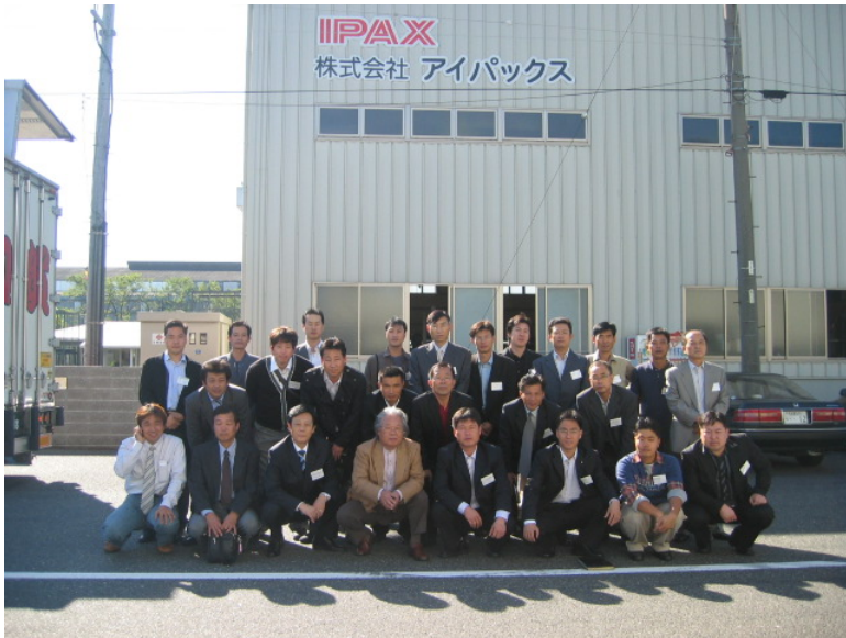
(6) ㈜IPAX : 2006년 10월 25일 09:30