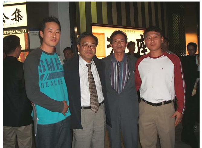
나고야의 환영회를 마치고