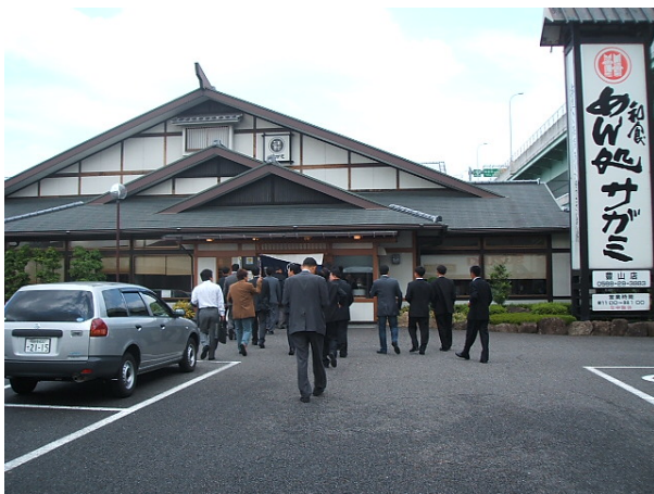
견학 전에 점심 식사를 하기 위해