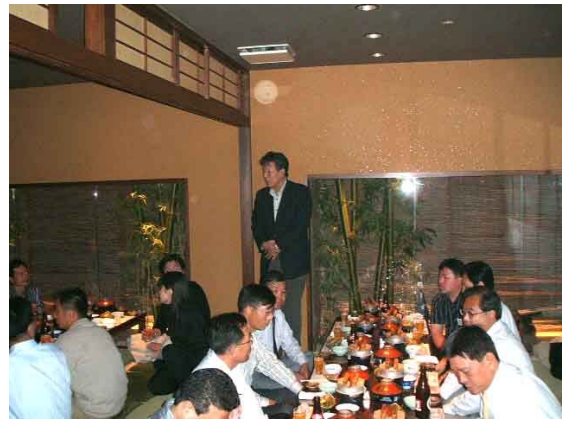
나고야 지역 환영회에서