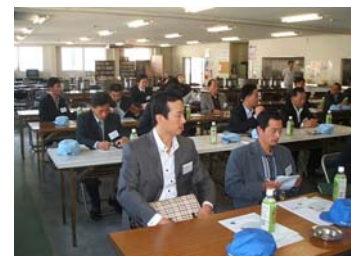
사장 인사말(아래) 질의 응답(위)