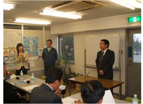
NIMURA사장의 회사 소개