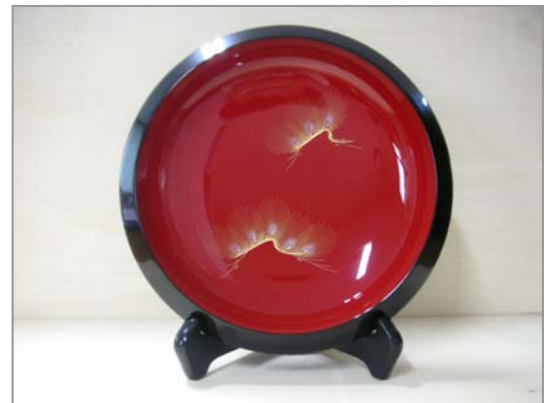
일본근포공업조합 증정품 “WAJIMANURI(輪島塗)”