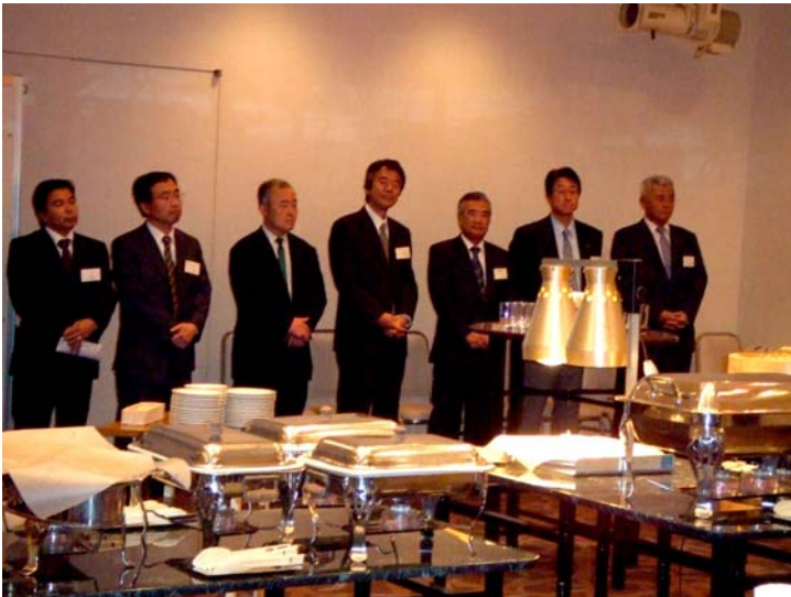
한국 포장협회가 일본 조합에 증정한 증