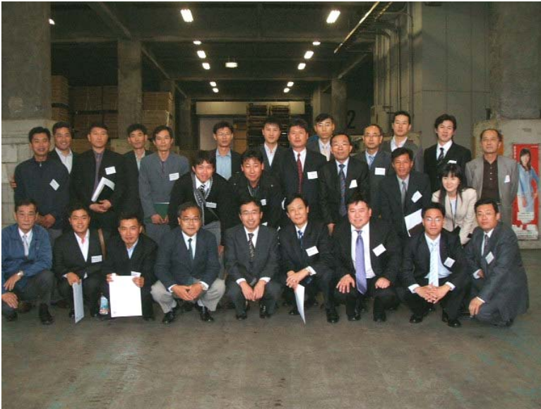
(3) O-PACK SERVICE : 2006년 10월 23일 13 : 00