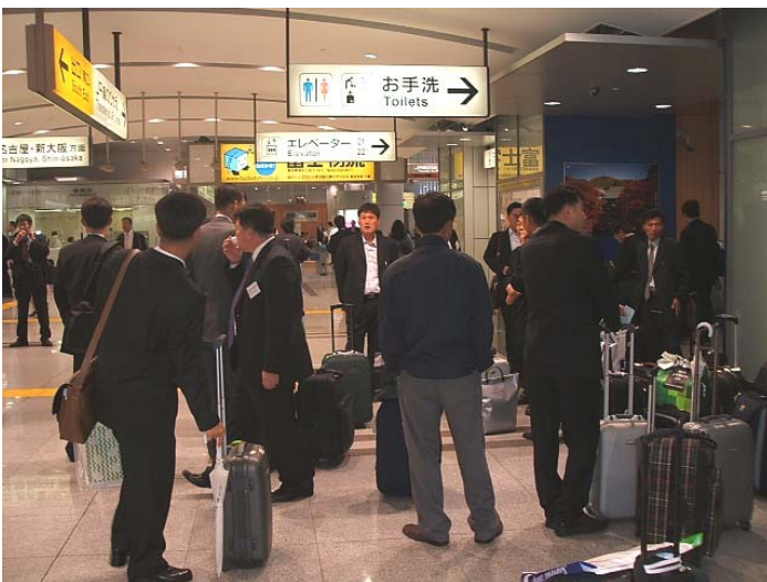
나고야로 출발하기 위해 시나가와역에서