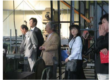
福部사장의 공장 안내