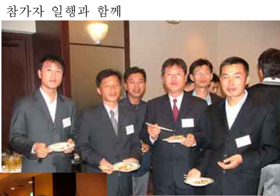
참가자 일행과 함께