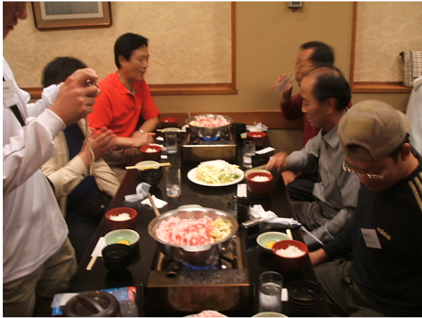
일본식 점심을 먹으며